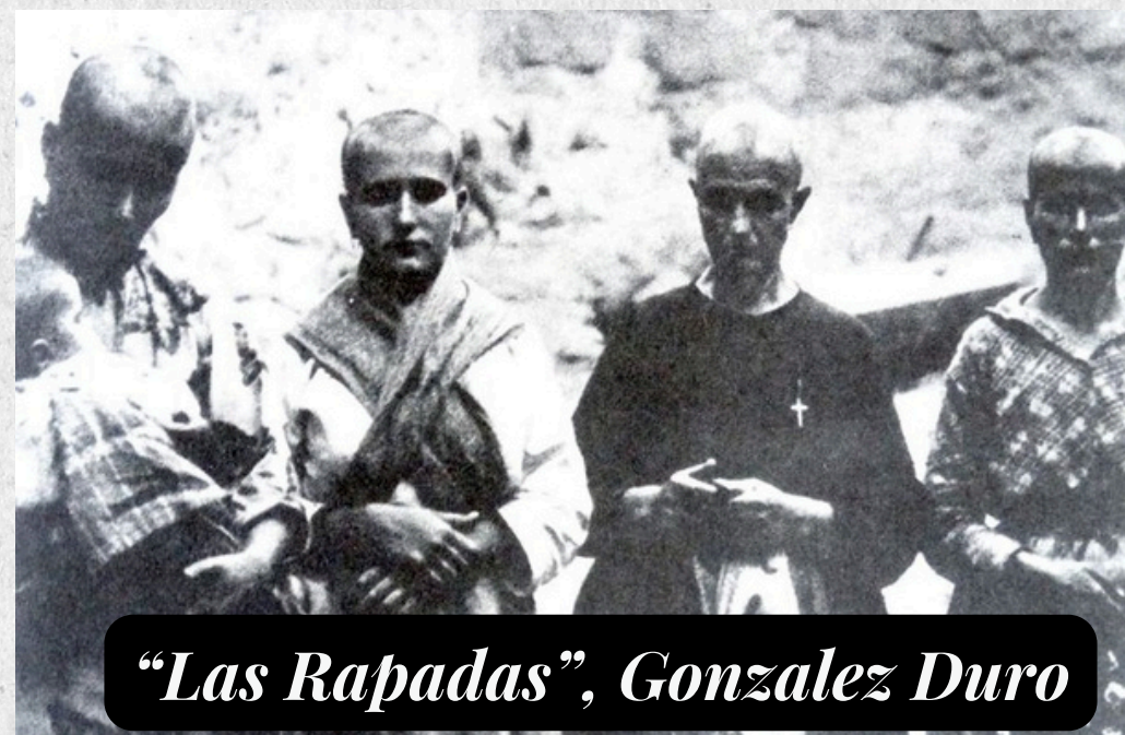
“Las Rapadas”, Gonzalez Duro

La marioneta protagonista de nuestra historia, acompañada por sus compañeras, sufrirá las consecuencias de la represión brutal. Serán rapadas en público, recordando las humillaciones de la plaza pública pero veremos como incluso en estos momentos opresivos, encontrarán refugio en sus sueños.