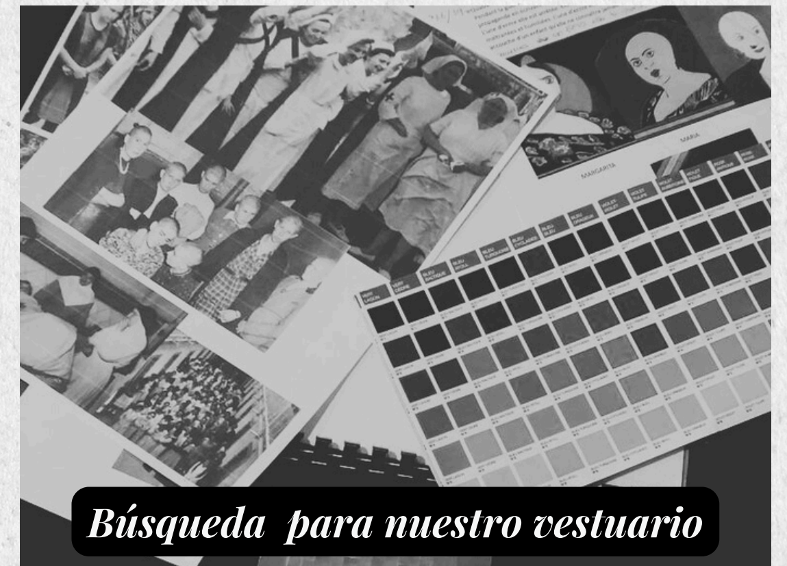
Búsqueda para nuestro vestuario

El vestuario será representado por símbolos como el famoso sombrero de la guardia civil, el delantal de las monjas, la chaqueta de trabajo cuando están en la oficina de correos, entre muchos otros. Cada prenda estará cargada de significado, utilizando el vestuario de esta manera para transmitir en símbolos cada uno de los personajes.